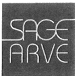
Schéma d'Aménagement de Gestion des Eaux du bassin de l'Arve